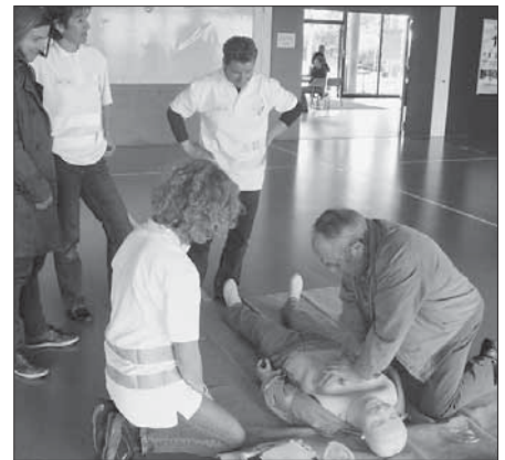
Die interessierten Besucher werden vor Ort informiert.