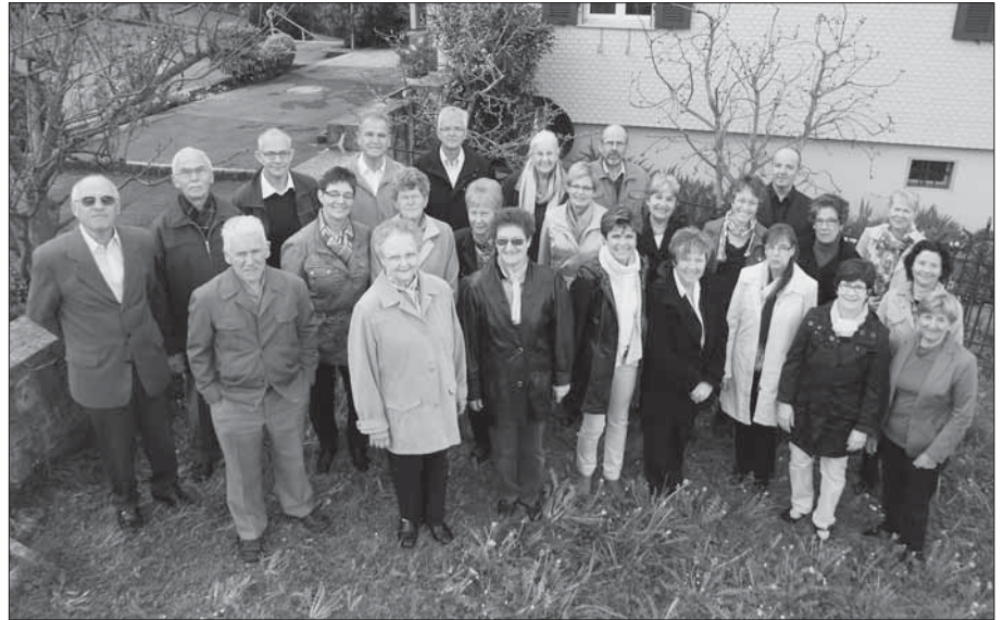
Der Kirchenchor feiert dieses Jahr das 100-jährige Jubiläum.