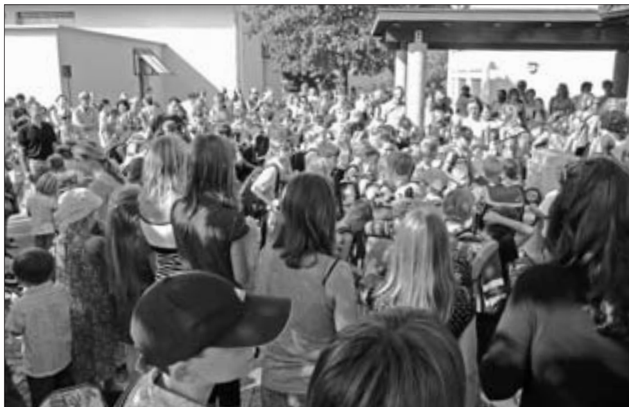
Für jede Schülerin und jeden Schüler ein ganz besonderes Ereignis: Der erste Schultag!