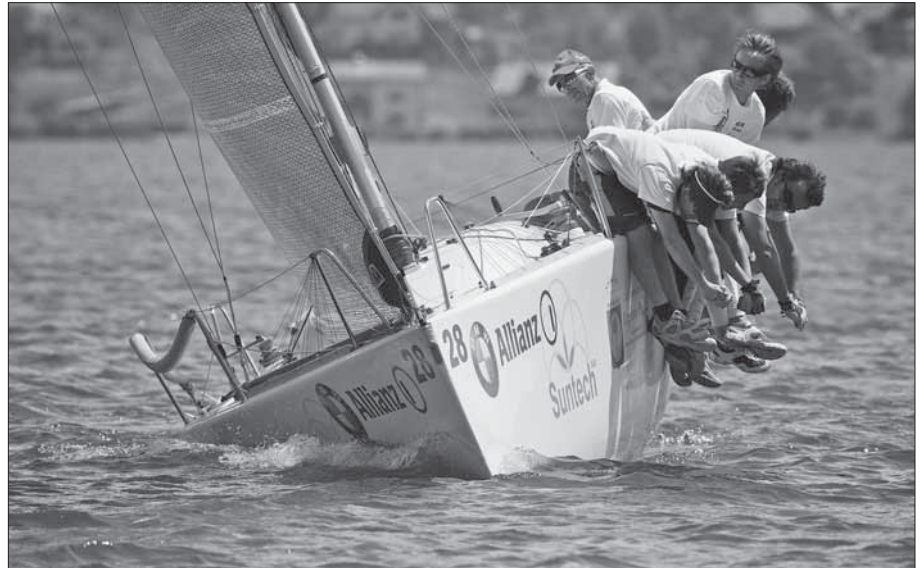
Teamarbeit in der Politik und im Sport bringt gute Resultate: Das Segelteam mit Uedliger-Beteiligung auf dem Weg zum Weltmeistertitel.