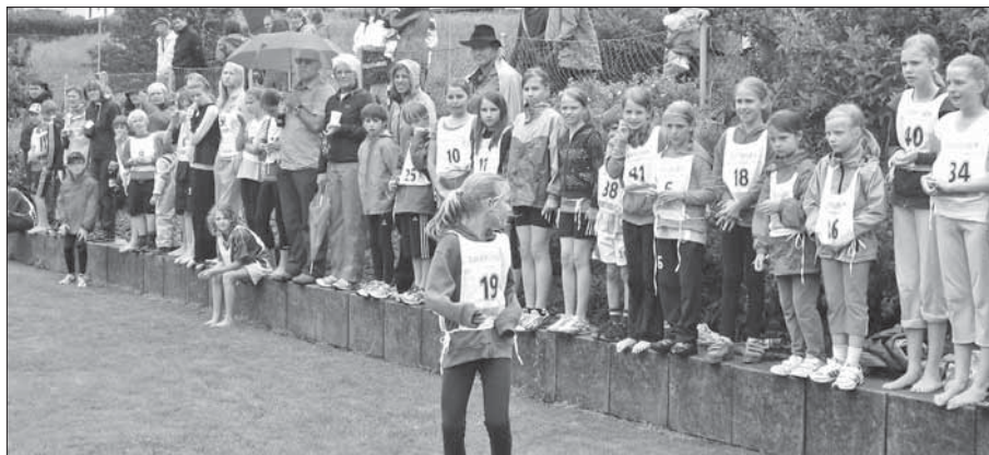
Das Publikum verfolgte gespannt den Wettlauf.