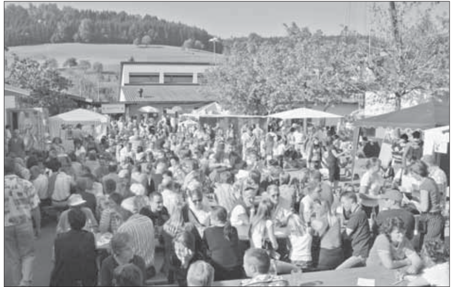
Eine Dorfgemeinschaft, in der die Kommunikation funktioniert.