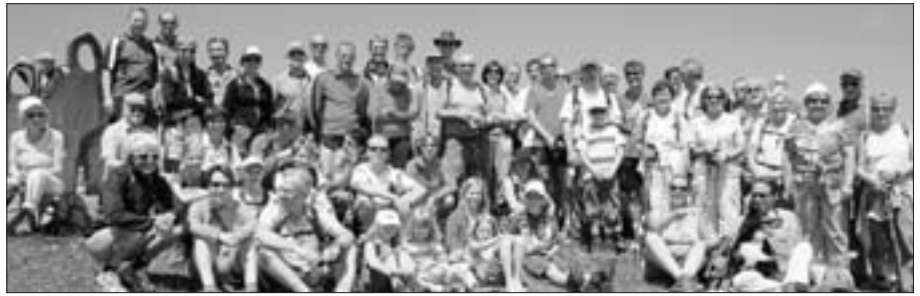
Teilnehmer am «Rigi Lauf» 2009