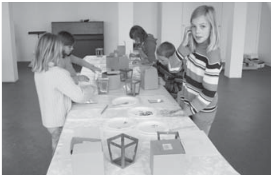
Selber gestalten macht grosse Freude.