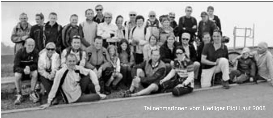
TeilnehmerInnen vom Uedliger Rigi Lauf 2008