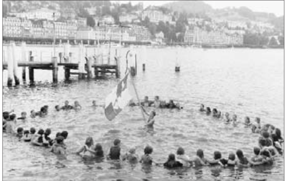
Der Abschluss des Lagers findet jedes Jahr im Vierwaldstättersee beim Bahnhof statt.