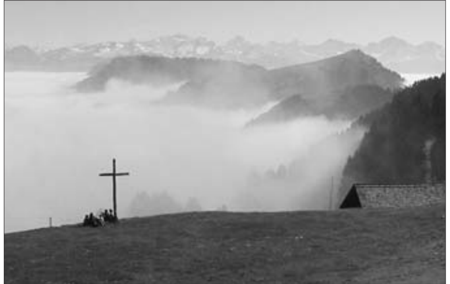
Positive Lebenseinstellung, eine Frage der Optik... dem Grau entfliehen, um Zuversicht zu gewinnen!