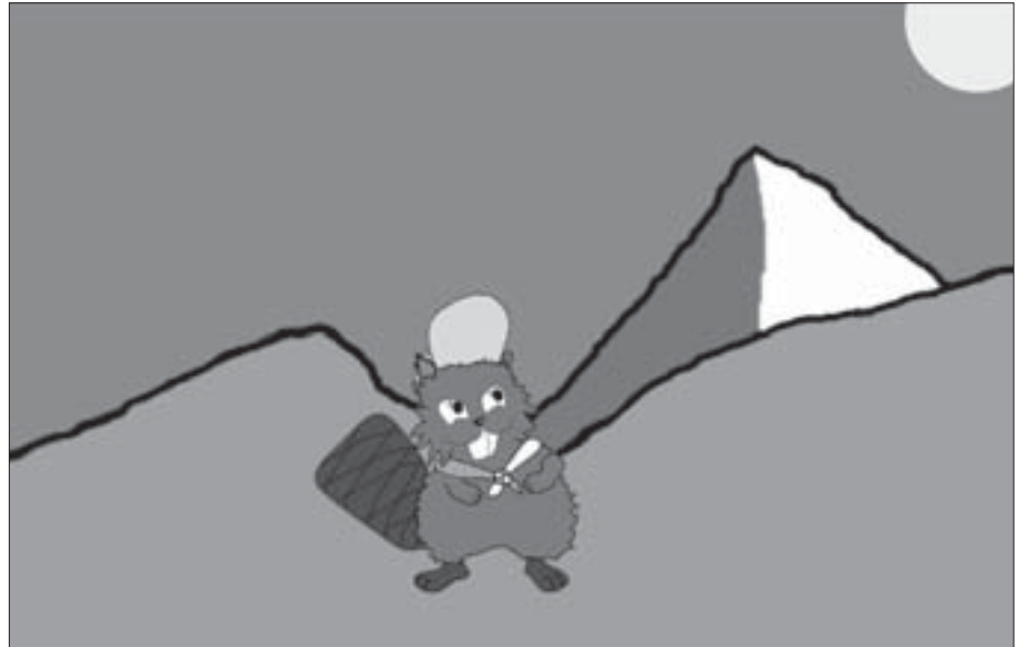
Neu in Udligenswil: Die Biberstufe in der Pfadi für Kinder von 5 - 7 Jahren.

Im Namen des Leitungsteams Carmen Alisa Koch