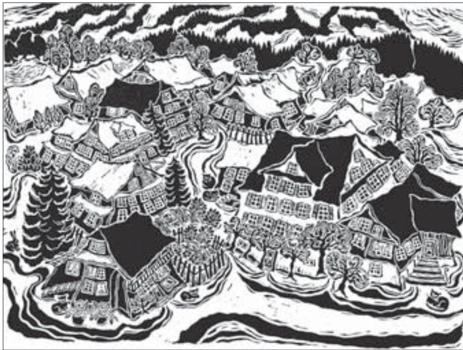
Foto Dorfzentrum vor ca. 50-60 Jahren